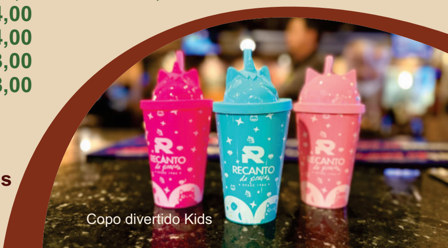
Copo divertido Kids