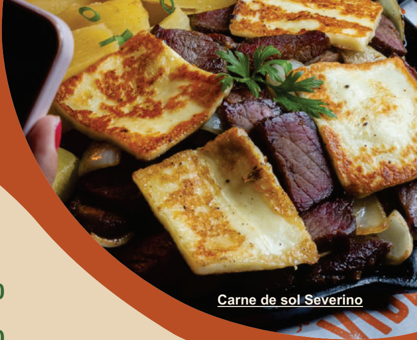
Carne de sol Severino